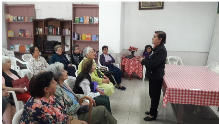
Av. División del Norte 1611 col. Cruz Atoyac C. P. 03310